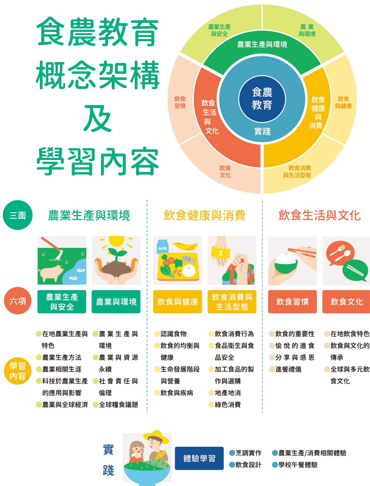
圖 1 食農教育 ABC 模式：食農教育三面六項